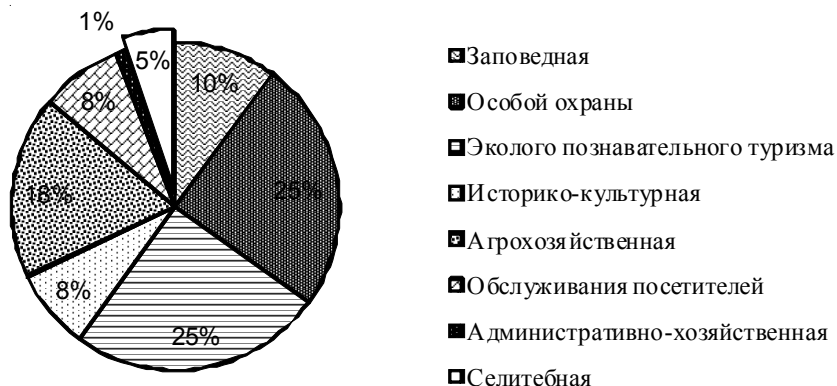
Рис. 2. Соотношение площадей функциональных зон ГУ ПП «Щербаковский», % *

При формировании управляемых ландшафтов принятие решений и разработка мероприятий по оптимизации природопользования опирается на изучение ландшафтной структуры и анализ современного состояния природно-антропогенных геосистем. Информационная база сформирована на основе данных, полученных в ходе экспедиционных исследований территории парков, дешифрирования крупномасштабных космоснимков и анализа фондовых материалов.