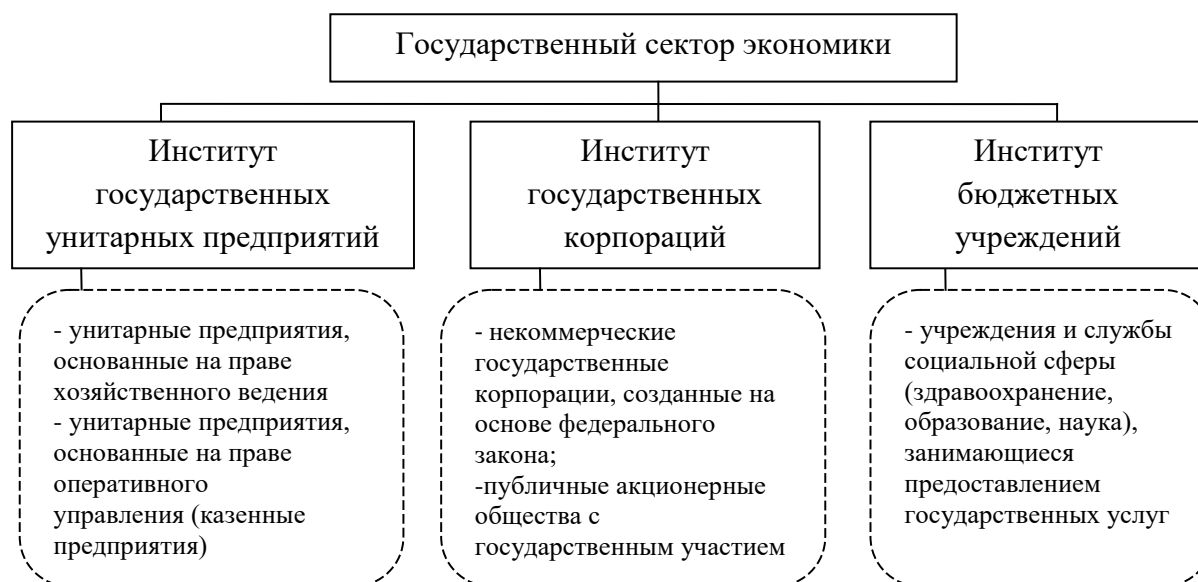
Рис. 1. Структура государственного сектора экономики

В эволюционном развитии государственного сектора современной российской экономики можно выделить три основных этапа (табл. 2).