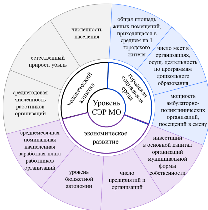
Рис. 2. Система показателей, применяющихся для определения уровня СЭР МО. Сост. авт.

На первом этапе осуществляется нормирование показателей (для приведения их к сопоставимому виду) методом минимакс и сверткой показателей по блокам по аддитивной схеме (формулы 1–3):