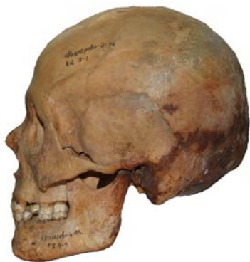
Рис. 28. Череп женщины 35-45 лет из погребения 1 кургана 2 курганного могильника Абганерово-III (колл. номер: 30-24)