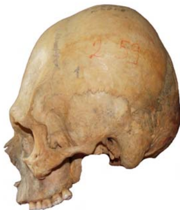
Рис. 8. Череп мужчины 25-30 лет из погребения 8 кургана 32 могильника Авиловский-II (колл. номер:2-59).