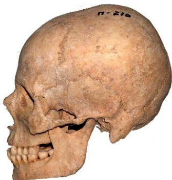
Рис. 26. Череп женщины (20-25 лет) из погребения 216, раскоп-II могильника Маячный бугор (колл. номер: 78-33)