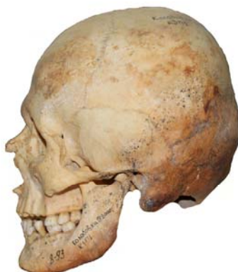
Рис. 29. Череп мужчины 25-35 лет из погребения 1 кургана 3 курганного могильника Колобовка IV (колл. номер: 8-93)