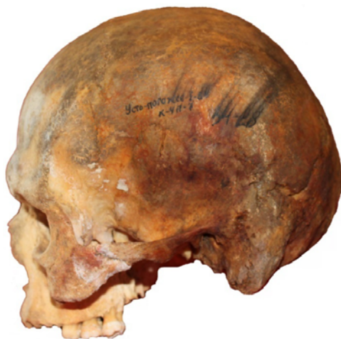
Рис. 9. Череп мужчины 20-30 лет из погребения 7 кургана 4 могильника Усть-Погожье-I (колл. номер 34-28)