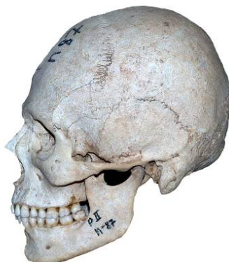
Рис. 27. Череп мужчины (35-40 лет) из погребения 87, Раскоп-II могильника маячный бугор (колл. номер: 78-54)