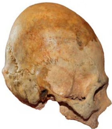
Рис. 7. Череп мужчины 50-60 лет из погребения 9 кургана 1 могильника Первомайский VII (колл. номер:17-89)