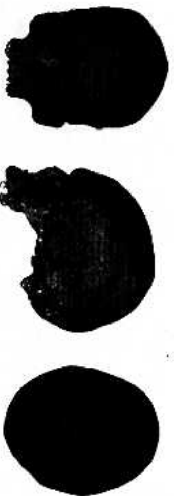
Рис. 1. Длиннохвостый череп мужчины около 30 лет из погребения 6 раскопа II 1996г.