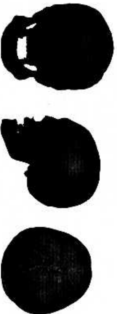
Рис. 2. Бруххвостый череп женщины старше 30 лет из погребения 5 раскопа II 1996г.