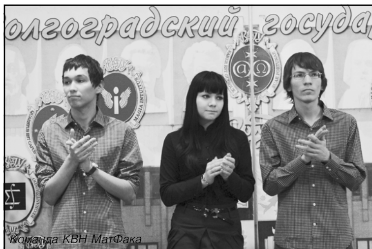
Команда КВН МатФака

От долгих представлений — к действию. Тема приветствия: "На встречу к звездам", и первой его показывает команда Факультета Математики и Информационных Технологий. Дебют команды, в составе которой, кстати, пятеро первокурсников, в новом сезоне мне лично понравился. Получился сплав в виде опыта и молодости, который достойно представляет наш факультет в играх КВН на кубок ВолГУ. На мой взгляд, приветствие, в той или иной степени, у всех команд получилось неплохо, чего нельзя сказать о последующих конкурсах. На разминке, откровенно говоря, взгрустнулось, и кроме шутки "Одного богатыря" вспомнить-то и нечего. Музыкальное домашнее