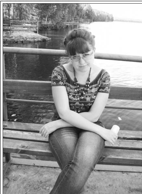
"На матфаке учат мыслить".

А.З.: Если самого себя ни в какие рамки не загонять, то выбор довольно большой: есть 1С, можно пойти работать стажером, есть различные банки, системные администраторы всегда нужны. Если нет каких-то конкрет-