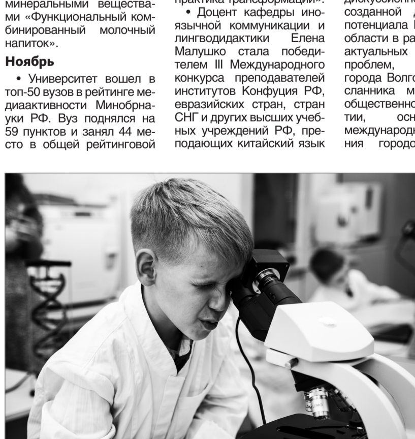
Дому научной коллаборации имени З.В. Ермольевой исполнилось два года. Школьники региона успешно развивают потенциал в университете