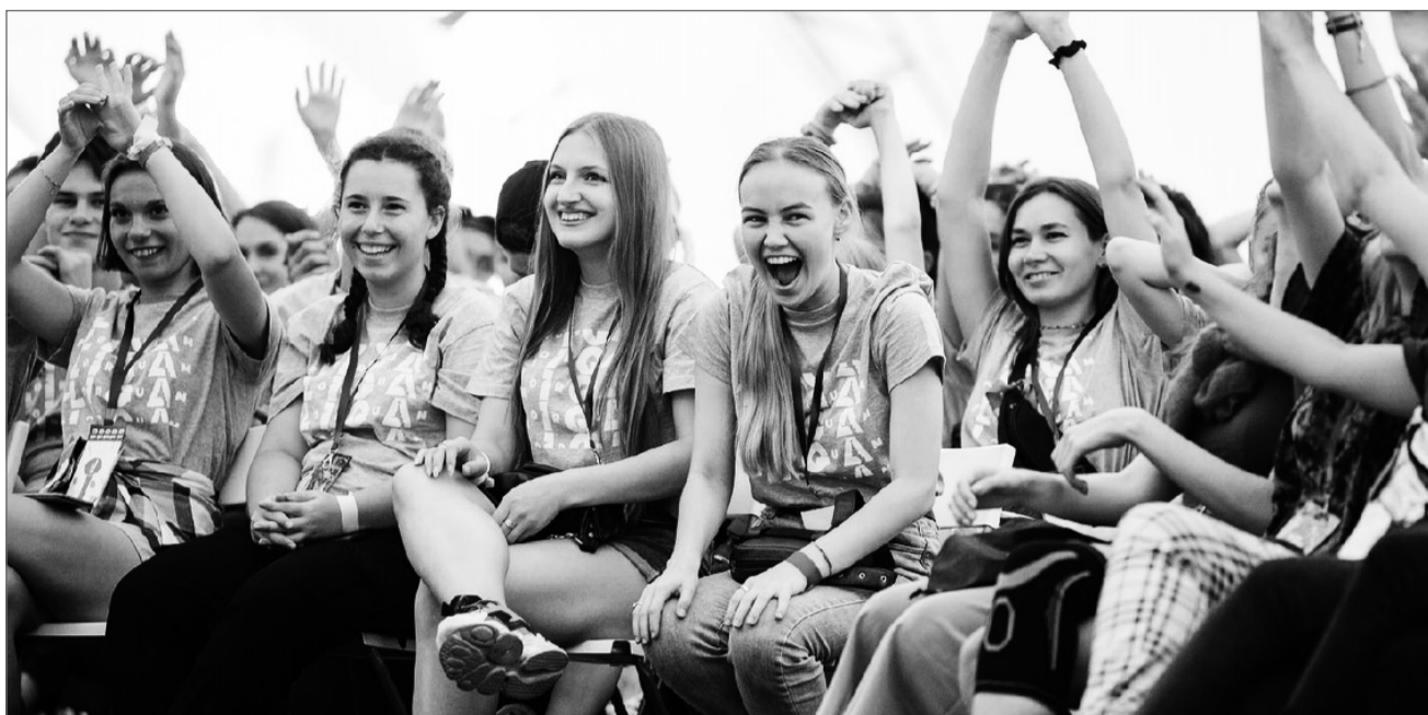
Студенты ВолГУ принимают активное участие в региональных, всероссийских и международных мероприятиях