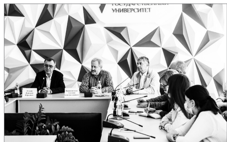
«Terra Media» – возможность пообщаться с представителями СМИ

– Меняются способы доставки информации, но остается