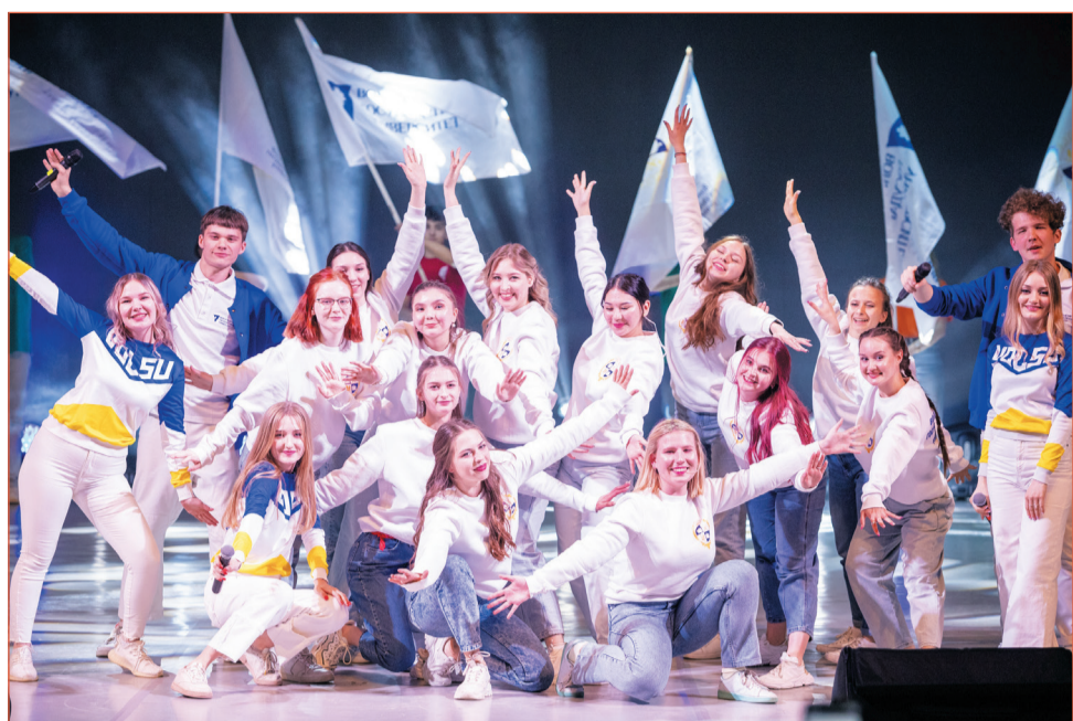
«Alma mater» – стильные, яркие, эмоциональные и запоминающиеся выступления студентов ВолГУ