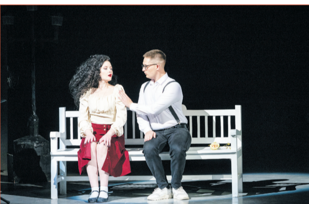
Выражая чувства и эмоции