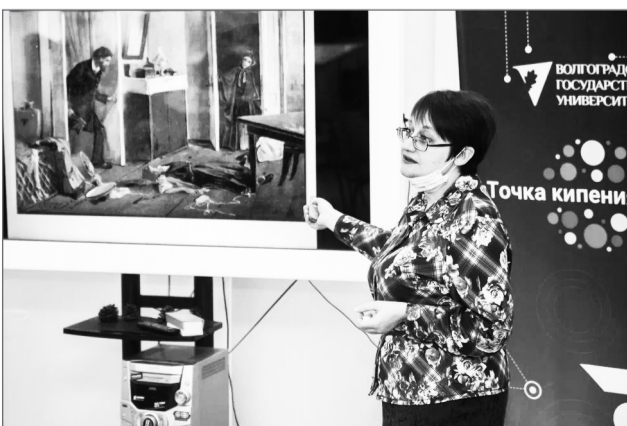
Научная библиотека ВолГУ проводит мероприятия по сохранению истории и традиций университета