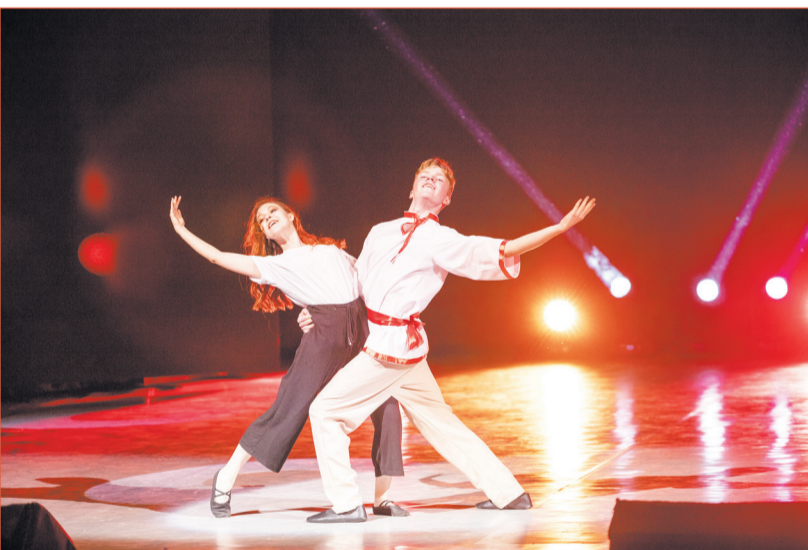
Выступаем с душой, искривляем задором молодости и вдохновения