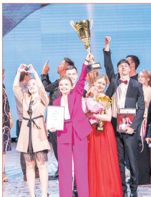
«Институт года» – институт экономики и управления!