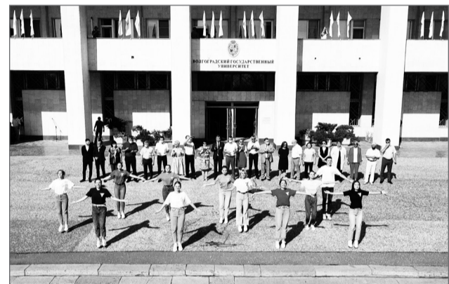
Студенты ВолГУ – лидеры в науке, творчестве, спорте!