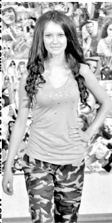
МИСС ФУРЭ 2011