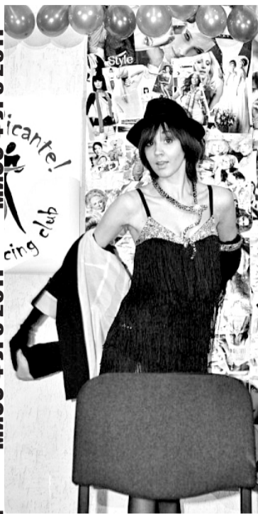
МИСС ФУРЭ 2011

Свет погас, на экране появился уже традиционный греб факультета, а после последовала видео-заставка, смонтированная Сергеем Шутовым. После чего, благодаря новым техническим возможностям, аудитория 4-29Г наполнилась звуками серены и красным светом, а на сцене появились финалистки, одетые в стили милитари, всем своим видом показывая, что они готовы к настоящей борьбе. Участницы сражались практически на рав-