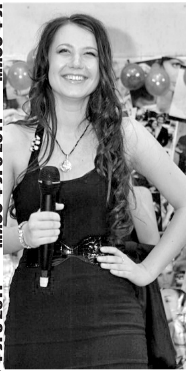
МИСС ФУРЭ 2011