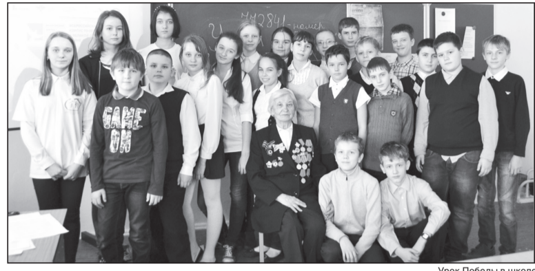
Урок Победы в школе

Активисты волонтерского центра Волгоградского государственного университета «Прорыв» провели «Уроки Победы» в общеобразовательных учреждениях Волгоградской области.