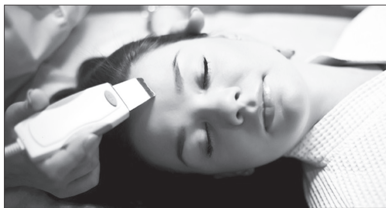
В санатории-профилактории ВолГУ оказывают услуги лечения дарсонвалем.

В целом курс дарсонвализации оказывает на организм человека тонизирующее действие: повышает иммунитет, снимает усталость, головные боли, увеличивает работоспособность.