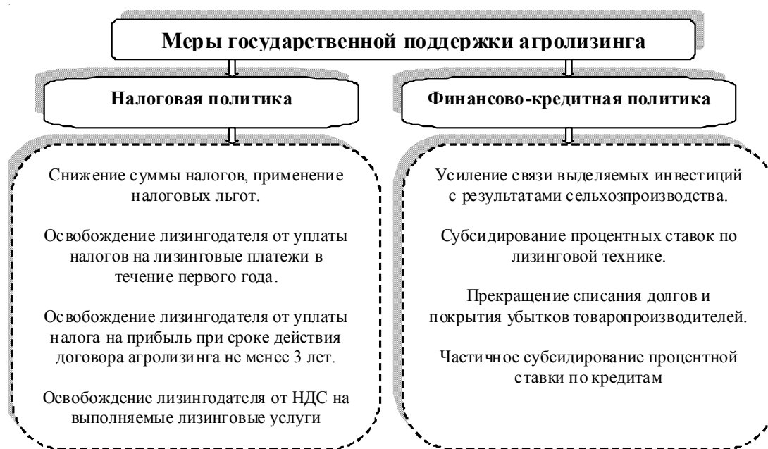
Рис. 2. Меры государственной поддержки агролизинга *

Меры государственной поддержки агролизинга посредством активизации налоговой и финансово-кредитной политики могут позволить более эффективно регулировать и формировать лизинговые отношения (см. рис. 2).