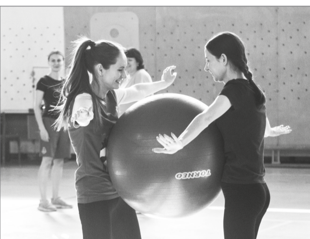
Спорт – сближает!