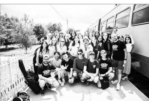
Активисты ВолГУ в компании Регины Тодоренко