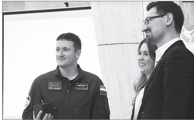
Передача миниатюрной статуэтки летчику-космонавту и Герою России Сергею Кудь-Сверчкову

«35 миллиметров высоты статуи, 3 грамма кобальт-хромового сплава и аддитивные технологии – на выходе символизм сочетания точной науки, олицетворяющей настоящее и будущее, и прошлого, формирующего память о событиях Великой Отечественной войны, коснувшихся в той или иной степени каждой семьи», – рассказывает о статуэтке проректор по