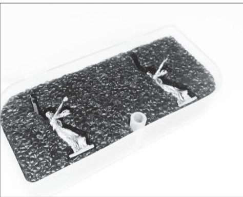
Высота статуэтки «Родина-мать зовет!» – 35 миллиметров

Проект «Космос Победы» Фонда соцпроектов «Наследие» приурочен к 65-летию запуска искусственного спутника Земли в СССР. В декабре 2022 года в Триумфальном зале музея-заповедника «Сталинградская битва» состоялась конференция «Герои Отечества: прошлое и настоящее», где были представлены предметы, созданные для отправки в космос в год 80-летия разгрома немецко-фашистских войск в Сталинградской битве. В начале февраля на МКС от Волгограда отправилась миниатюра монумента «Родина-мать зовет!», выполненная студентами Волгоградского государственного университета.