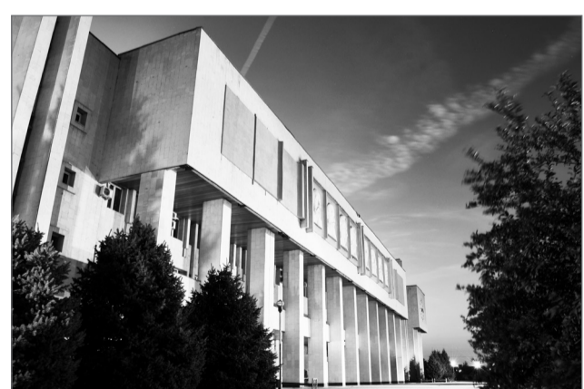
Наша alma mater