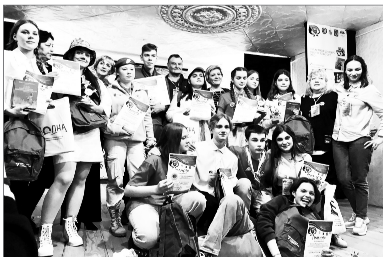
Будущее российской педагогики

С целью формирования гражданско-патриотической позиции старшеклассника через его участие в социально-педагогической деятельности с младшими школьниками и вовлечение в волонтерское движение в МБОУ ДО «Ленинский Детско-юношеский центр» Ленинского муниципального района Волгоградской области прошел шестой областной конкурс юного вожака «Вожатёнок – 2023», участниками которого стали 13 ребят из Среднеахтубинского, Ленинского муниципальных районов, г. Волгоград.