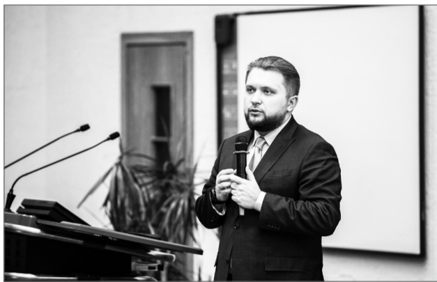
Зампредседателя Госдумы Борис Чернышов рассказал, как найти свой путь

найти единомышленников. – Мы заметили, что люди хотят стать частью чего-то большего. Мы все идем в какие-то общественные объединения, в организации. Мы все хотим быть полезными обществу. Мне хотелось бы, чтобы каждый имел возможность для реализации, – подчеркнул Борис Чернышов. – Студенты ВолГУ – самые лучшие. В Волгоград я приехал только для встречи с ними. Та энергия, которую я почувствовал в обратной связи, говорит о том, что это ребята, ищущие ответы, желающие идти вперед. Они хотят развиваться вместе