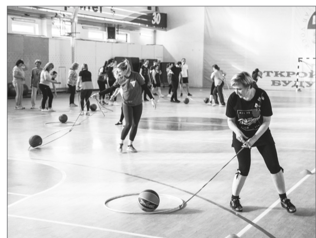
Профсоюз – хороший и конкурсы интересные