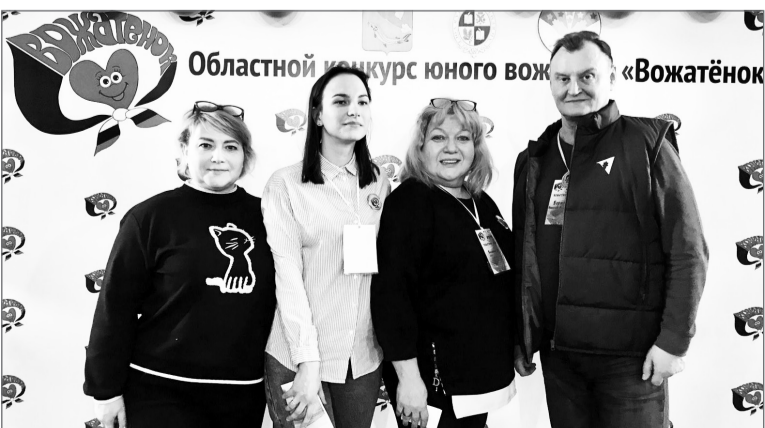
Строгое, но справедливое жюри