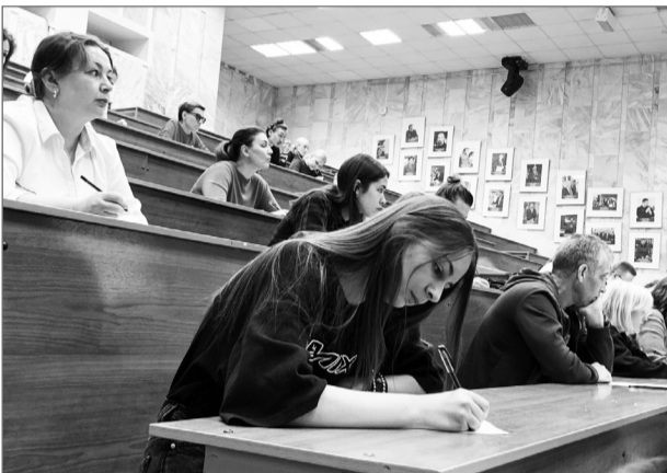
Участники акции призывают беречь великий русский язык

но мнения участников разнились: для кого-то диктант был простым, а для кого-то стал настоящим интеллектуальным испытанием. Тотальный диктант действительно объединяет людей и еще раз доказывает, что писать грамотно – модно!