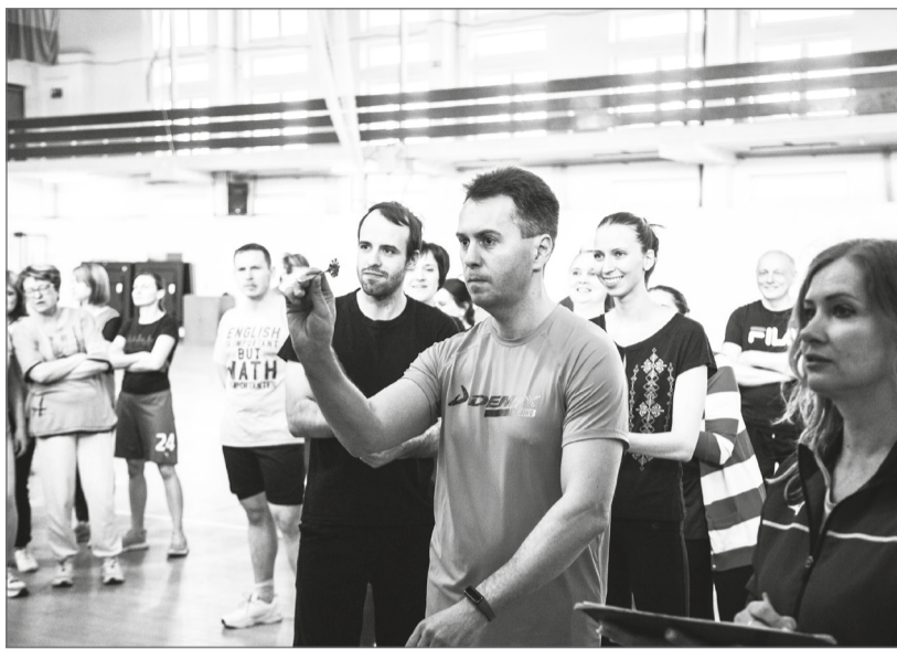
Мгновение до броска «в яблочко»

6 место у команды «Веселые стартеры» – это сборная института права, института истории, международных отношений и социальных технологий и издательства ВолГУ. В её составе