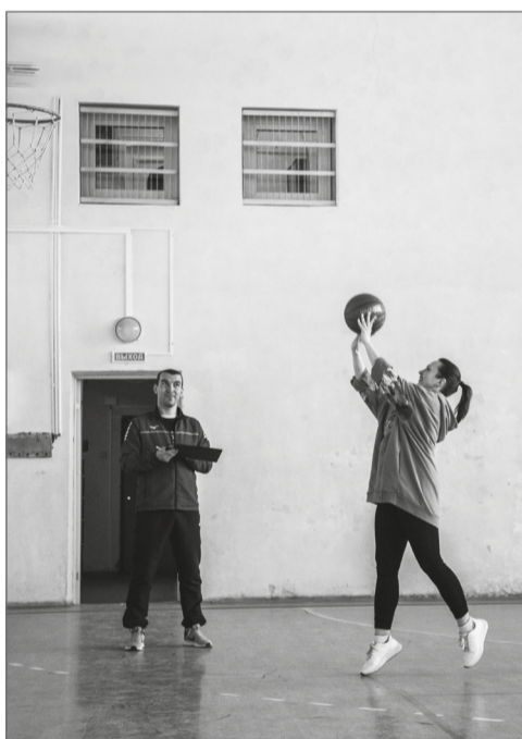
Мяч в корзину