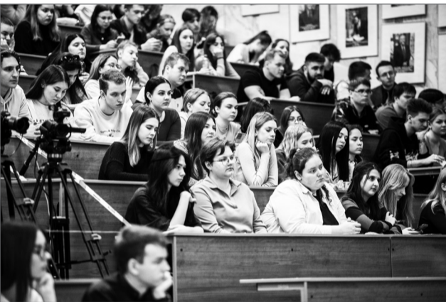
Студенты ВолГУ с интересом слушали спикера