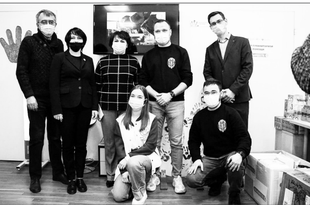
На открытии Центра #МЫВМЕСТЕ

Профсоюзная организация сотрудников ВолГУ и Профком студентов. Открытие Центра состоялось в рамках акции Выходные #МЫВМЕСТЕ, которая объединила ведущие российские вузы. В ВолГУ акция завершилась «Спортивной Масленицей», участие в которой приняли более 100 студентов ВолГУ.