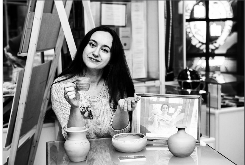
Одно из новых направлений выставки – керамика, изготовленная на гончарном круге