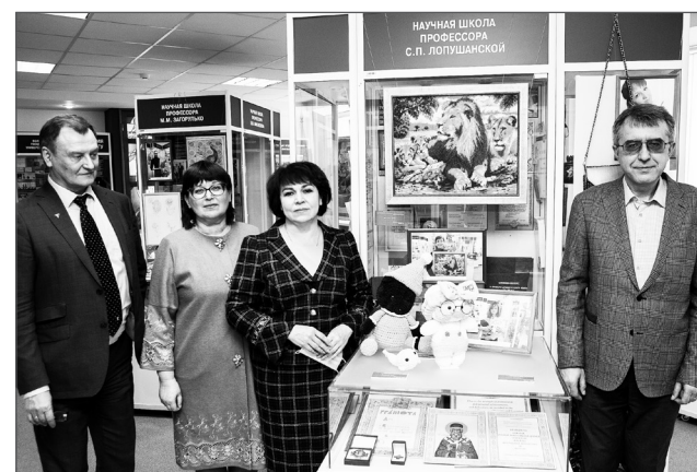
Одни из первых посетили выставку представители ректората ВолГУ

Вышивка крестом, картины из алмазной мозаики, праздничные кружки, украшенные