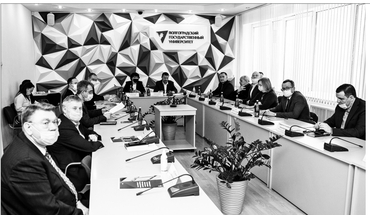
Полосу подготовила Вера Фетисова

В планах Студенческого клуба межкультурной коммуникации проведение тематических встреч: «национальные традиции и обычаи», «дни национальной моды», «деловой этикет в различных странах мира и особенности ведения переговоров», «традиционные детские и спортивные игры народов мира».