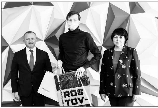
Победители получили ценные призы и подарки от партнеров конкурса