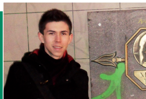
ИНТЕРВЬЮ СО СТИПЕНДИАТОМ