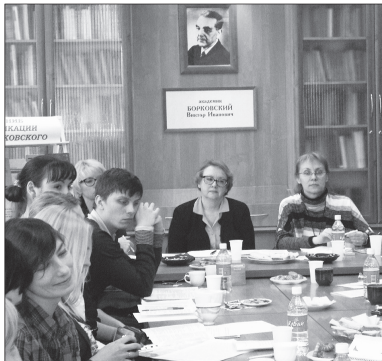
Борковские чтения – традиционное научное мероприятие, которое организует кафедра русского языка ИФММКК.