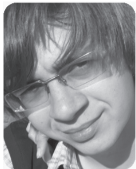
Слово редактора: Александр АКУЛИНИЧЕВ