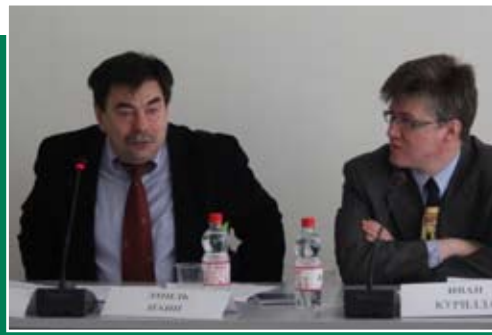
НАУЧНАЯ ВЕСНА - 2011 НА ФАКУЛЬТЕТЕ ФИМОСТ