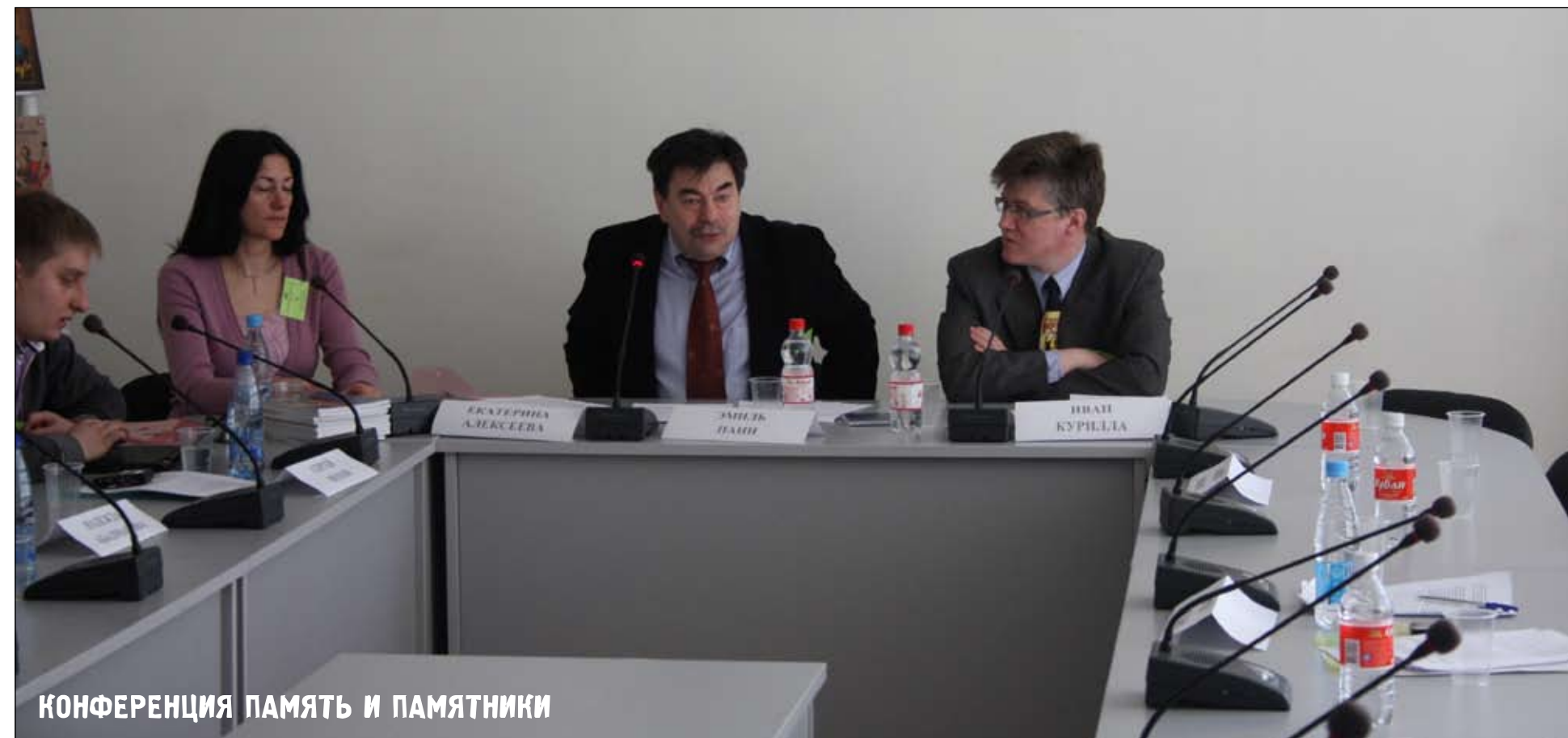
КОНФЕРЕНЦИЯ ПАМЯТЬ И ПАМЯТНИКИ