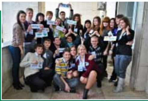
МОДЕЛЬ ООН в ВолГУ